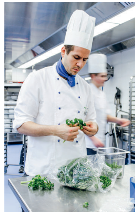
Bereits rund 100 Care-Küchen setzen auf Hugentobler Kochsysteme.