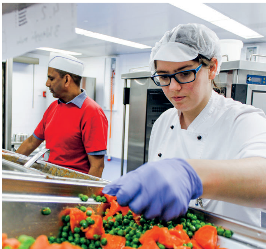
Hugentobler unterstützt Care-Küchen mit intelligenten Küchenkonzepten und innovativen Kochsystemen.

Was sich in der Gastronomie bewährt, setzt sich auch in Grossküchen von Heimen und Spitälern erfolgreich durch (siehe Beispiel Siloah AG in «Heime und Spitäler» März 2016, Seite 52). Bereits setzen im Gesundheitswesen rund 100 Care-Küchen auf die Kochsysteme von Hugentobler und profitieren von den klaren Vorteilen: effizient und gut kochen zu fairen Preisen – und Patienten und Heimbewohner geniessen gesunde, abwechslungsreiche Mahlzeiten mit regionalen Produkten. ■